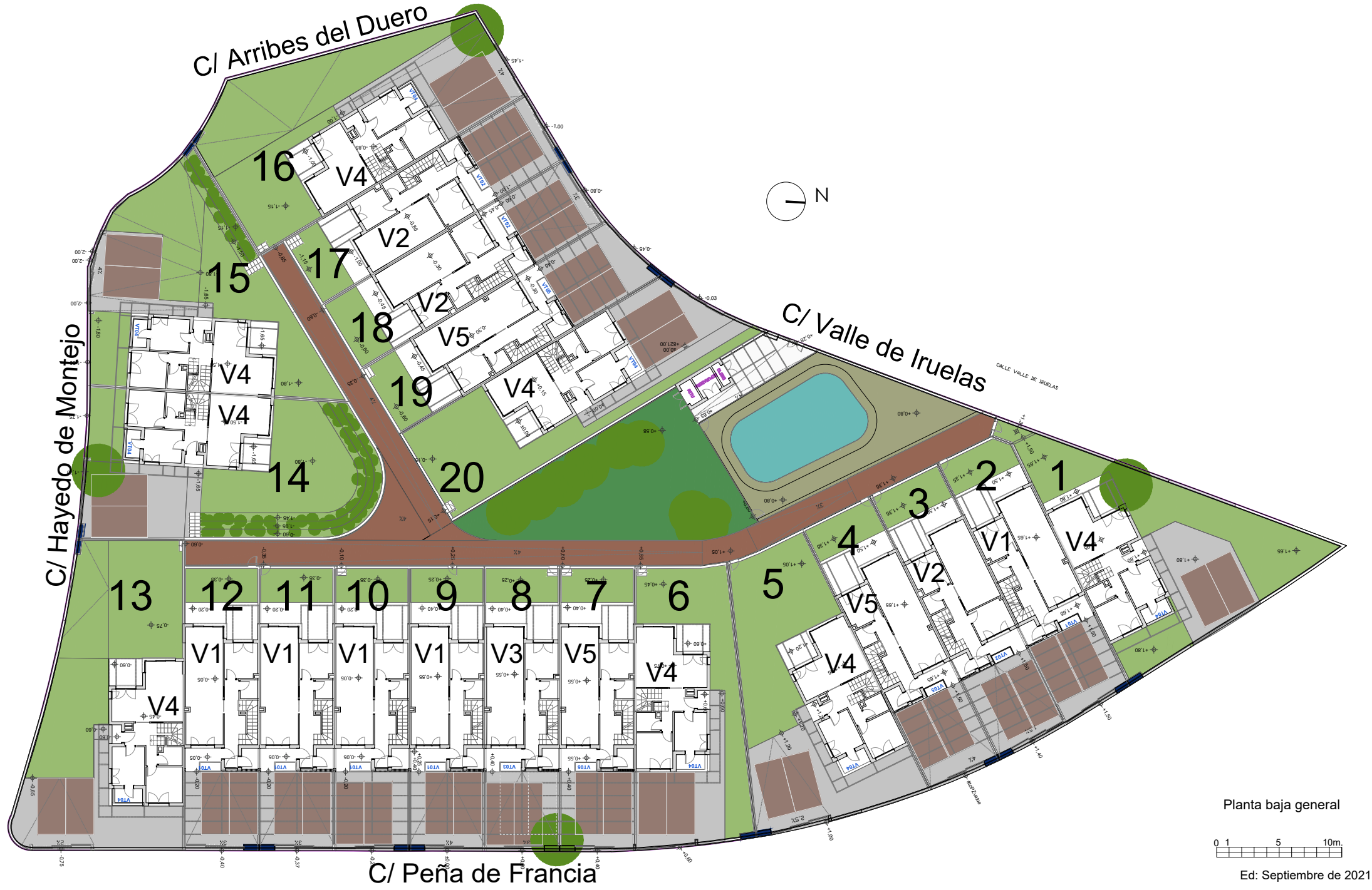
Planta baja general