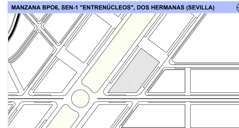
UBICACIÓN: PORTAL 8, 9 y 10. PLANTA 1ª A 9ª