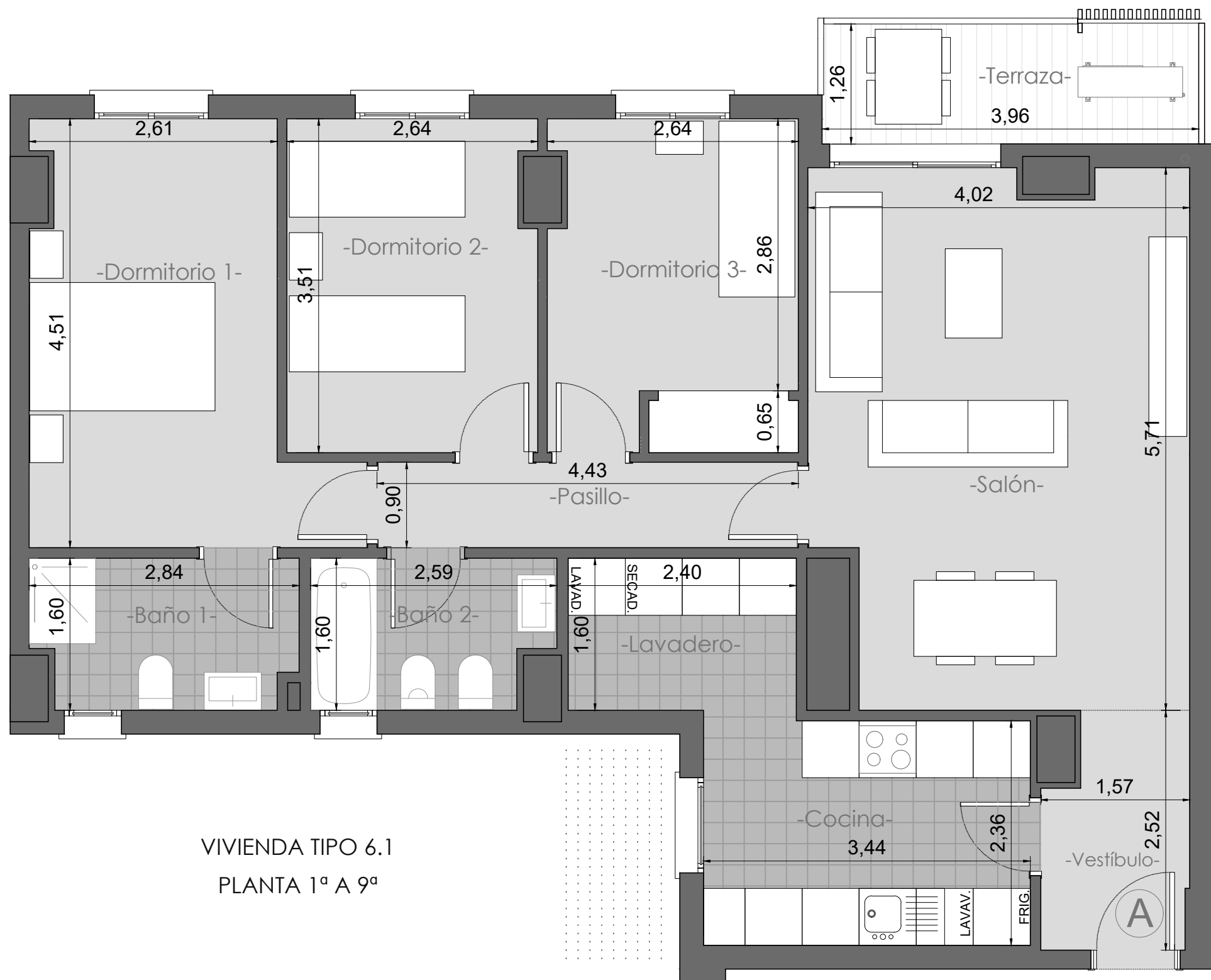
VIVIENDA TIPO 6.1 PLANTA 1ª A 9ª